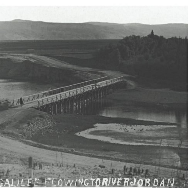
גשר בדגניה, שלהי שנות ה-20

האיסוף של הצילומים נמשך כבר יותר מ-40 שנים. את רובם רכשה סילבר-ברודי מסוחרים או מאספנים אחרים. חלקם פשוט קיבלה מצלמים שהכירה או החי ליפה תמורת תצלומים אחרים.