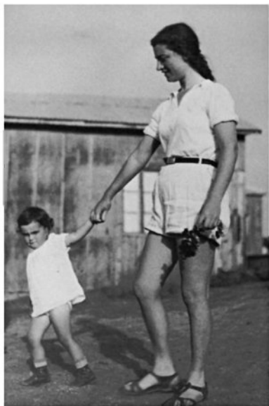
"אישה צעירה וילד", כפר סאלד, 1935

מריסבא וליריחו), הגבעות הברורות הוזהרות בשמש, בקושי ני תן למצוא צל שיעזור להרכיב מתווה של צילום טוב. אבל כש חיים בארץ הזאת ולומדים אותה באהבה ובהבנה, מניחים לנופים לשקוע בתוכנו, אותן גבעות עצמן נהפכות לחלק מחיינו". סילברברודי, וזו אחת העובדות הבולטות למי שמעיין בספר, מעניקה חשיבות וכבוד שווים לצלמים מקצועיים ולצלמים אנרנימיים או פחות נודעים. היא מדגישה בספר ובשיחתנו את החשיבות שיש בעיניה להצגה של צילום חובבים לצד צילום מקצועי, לחשיפה של צילומים משפחתיים, לצד צילומים ממסדיים, שהוזמנו עבור הסוכנות היהודית, קק"ל או סולל בונה. צילומי חתונות, מחול או אוכל חשובים ומרתקים בעיניה לא פחות מצילומים היסטוריים של הקמת ישוב בעמק הירדן. בין היתר כתבה בספר: "צל" מים שלא הועסקו בגופים הצינוניים הרשמיים עבדו בערים