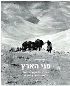
עטיפת הספר